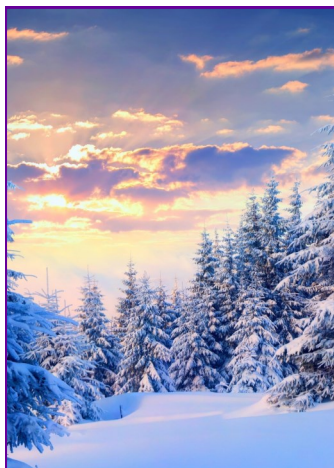
Зимний выпуск, февраль 2019 (№ 15)