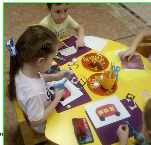
Группа № 5 «Осьминожки»

Мы многое можем делать руками: Игрушки из глины и оригами, Рисуем, и лепим, И клеим, и шьем, И дружно играем в группе потом.