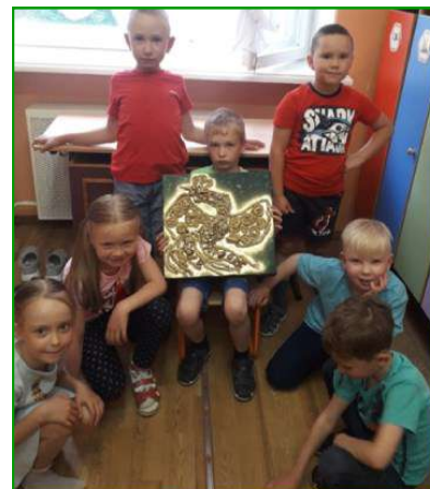
Коллективная работа «Жар-птица» группа № 8