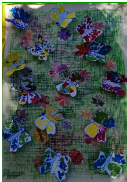
Коллективная работа «Бабочки» группа № 7