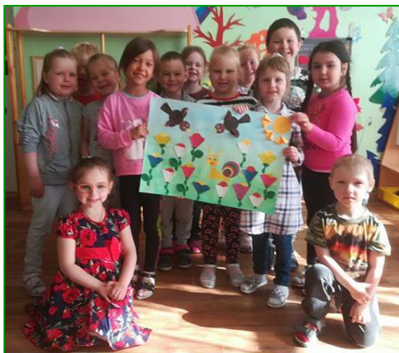
Коллективная работа «Летняя полянка» группа № 9